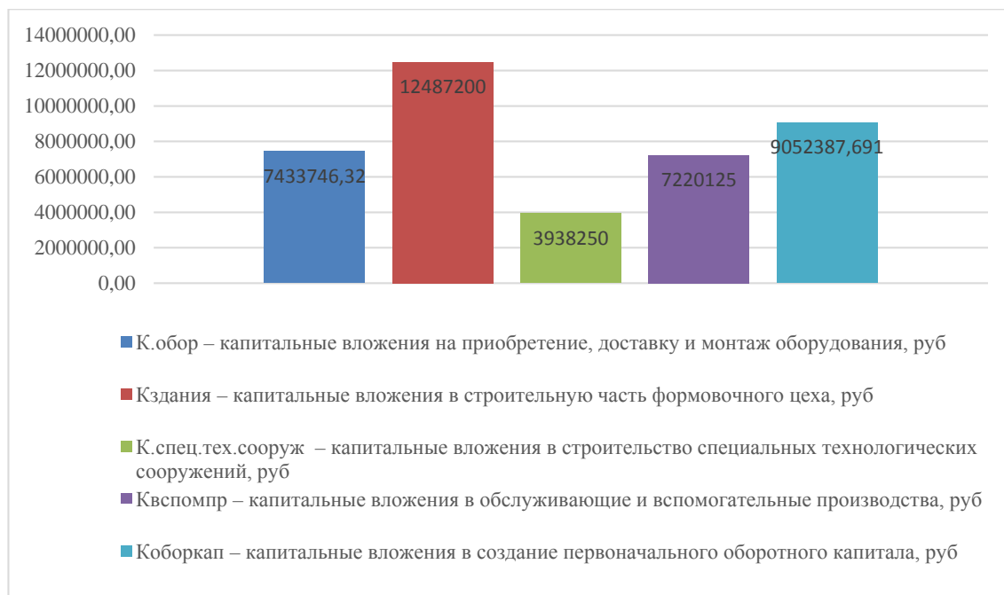
Рисунок 1 – Структура капитальных вложений, руб.

После расчета общей суммы капитальных вложений необходимо построить столбиковую диаграмму, отражающую структуру данных вложений. Пример данной диаграммы представлен на рисунке 1.