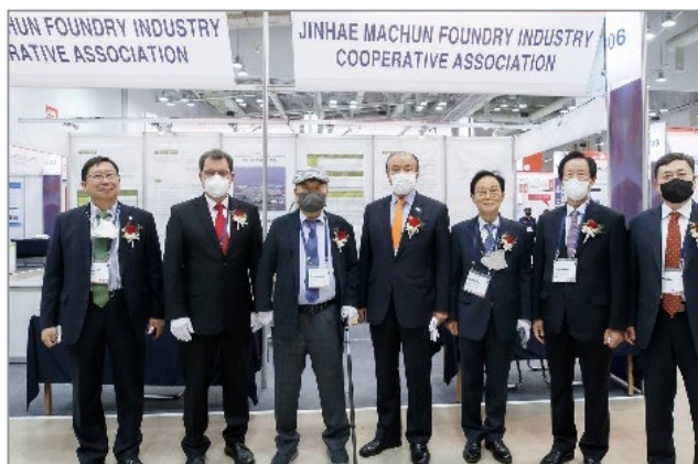
Участники церемонии открытия выставки