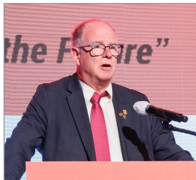
Церемония открытия. Приветственная речь Генерального секретаря WFO Эндрю Тернера