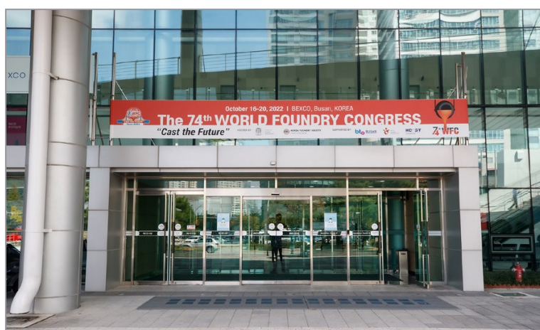
Место проведения 74-го Всемирного Конгресса Литейщиков

В период с 16 по 22 октября 2022 г. в городе Пусан (Южная Корея) состоялся 74-й Всемирный Конгресс Литейщиков (74 th World Foundry Congress), в котором в очном формате приняли участие представители таких стран, как Южная Корея, Япония, Китай, Германия, Польша, Испания, США, Великобритания, Франция, Словакия, Таиланд, Турция, Чехия, Индия, Россия, Словения, Канада, Финляндия, Сингапур, Бразилия, Дания, Италия, Швеция, Нидерланды, Австралия, Беларусь, Бельгия, Хорватия, Египет, Норвегия и Румыния. Всего в Конгрессе участвовали 508 делегатов из 32 стран.