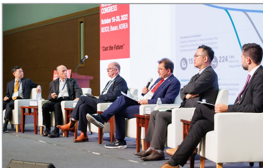
Обсуждение влияния возобновляемых источников энергии и электротранспорта на стратегию развития литейного производства