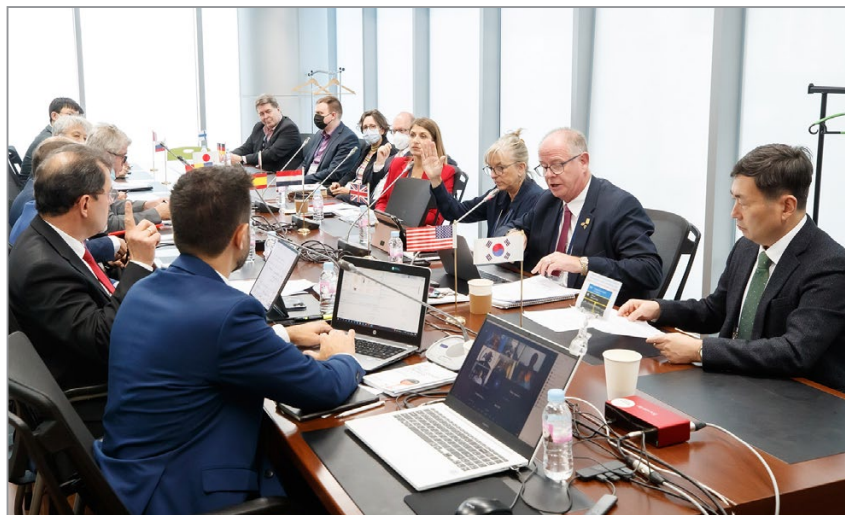
Заседание Генеральной ассамблеи WFO

и цифровые технологии в литейном производстве. Принято решение, что победители получают билеты для участия в международной выставке GIFA.