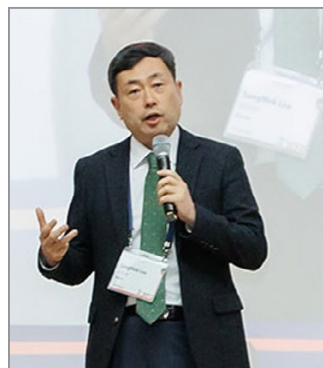
Завершающая речь Председателя Конгресса доктора Санг Мок Ли