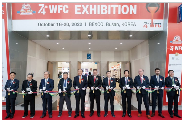
Церемония открытия выставки

После завершения пленарного заседания рядом с главным залом состоялась церемония открытия выставки. В торжественной обстановке организаторы Конгресса, руководители Корейского литейного сообщества и Корейской ассоциации литейной промышленности (KFICA) под аплодисменты гостей перерезали красную ленту, тем самым, официально дали старт работе выставки.