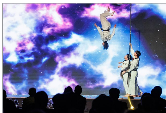
Выступление команды по тэквондо университета Донг-А