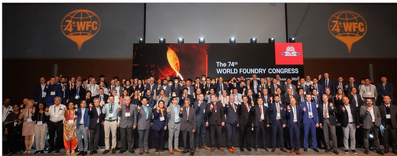
Групповое фото участников Конгресса