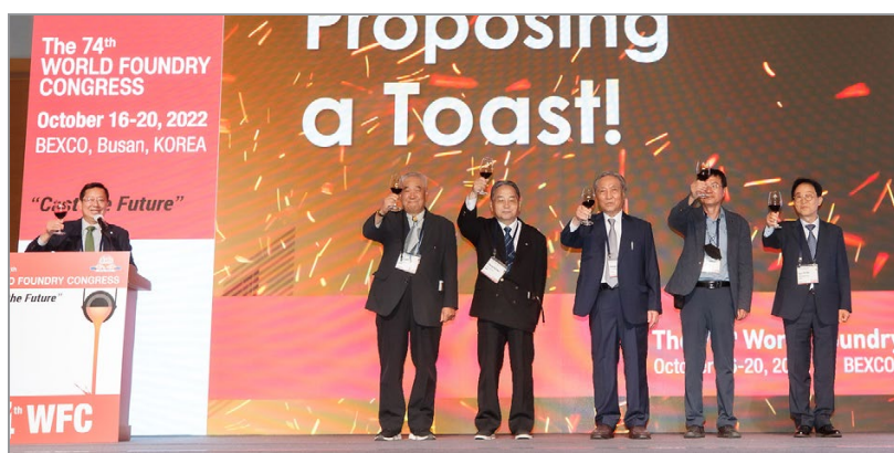
Поздравления от Корейского литейного сообщества