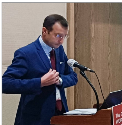
Доклад в рамках Конгресса