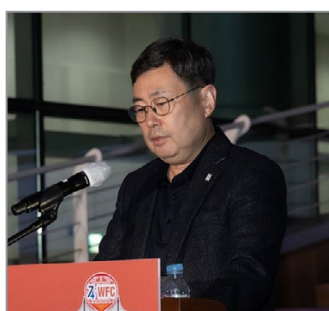
Приветственная речь Председателя Конгресса доктора Санг Мок Ли