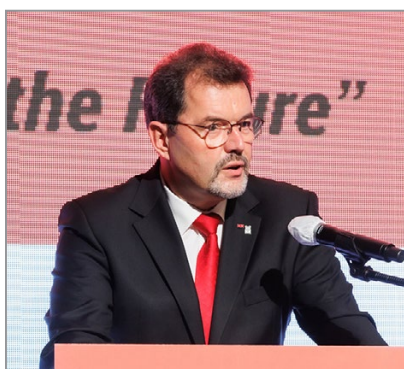
Церемония открытия. Приветственная речь Президента WFO Карстена Кульгатца