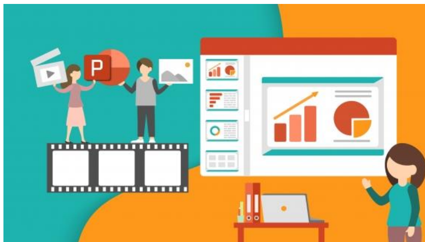
Рис. 2 – PowerPoint – программа для создания презентаций

смонтированный с помощью специальной программы SonyVegas, 3D модели, спроектированные с помощью специальной программой Blender. Именно для этого в современных реалиях педагогу и необходимо иметь навыки владения современными информационными технологиями, с помощью которых педагог может показать ученикам видеоролик, презентацию, смоделировать эту ситуацию в специальных программах, которые помогут детям визуализировать материал, и как следствие его лучше закрепить и применять в дальнейшей практике.