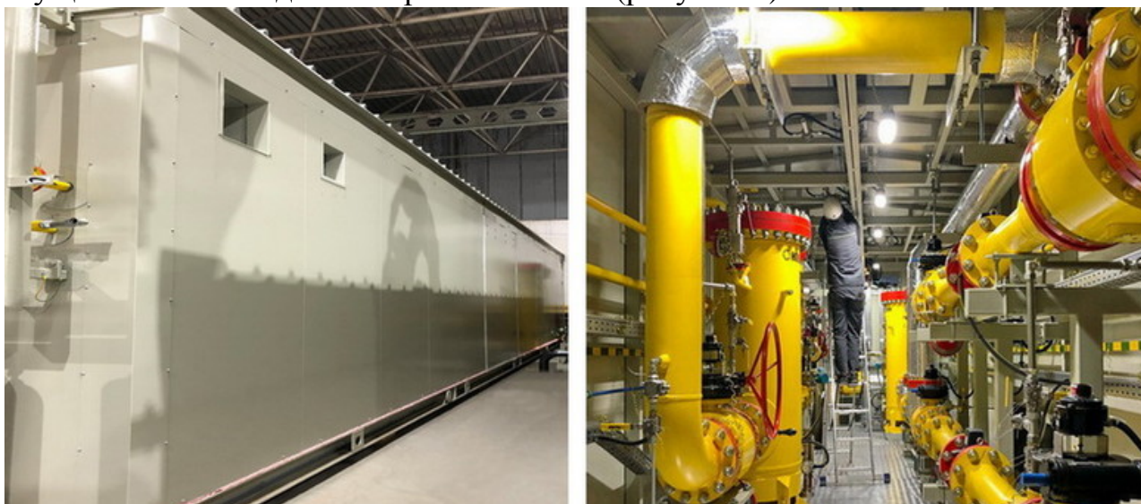
Рисунок 2 – Блок-бокс ГПС

ГПС располагается в отдельном модуле – блок-боксе и обладает всеми необходимыми техническими системы, включая системы жизнеобеспечения и безопасности. Она полностью автоматизирована, а регулирование осуществляется из диспетчерской объекта (рисунок 2).