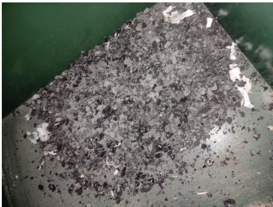
Рисунок 2 – Результаты измельчения кусков асфальтобетона на шредере