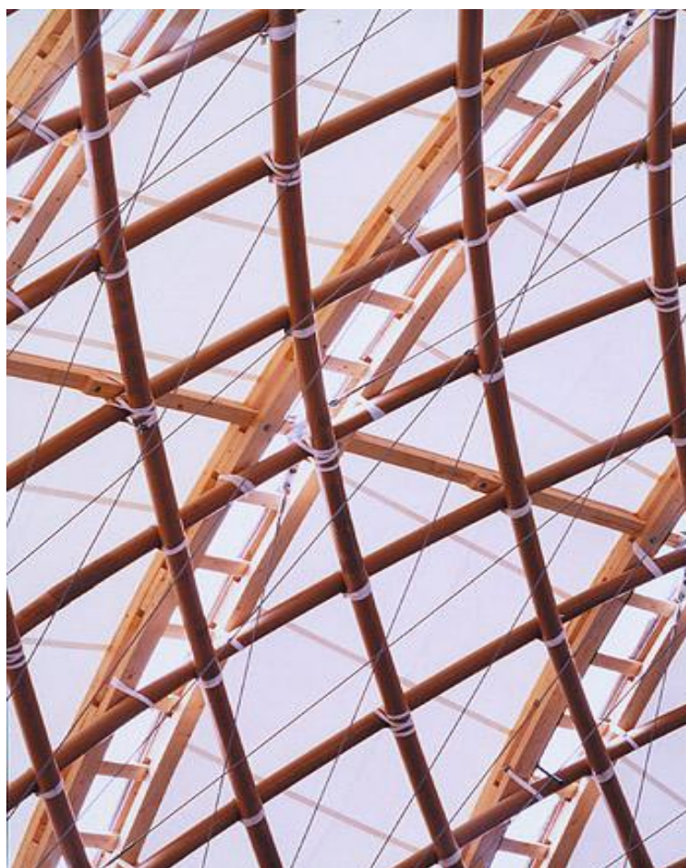
Рисунок 2 – Оболочка конструкции из картонных трубок

В собранном состоянии изогнутые цельные стержни (без промежуточных стыковочных элементов), многократно пересекаясь между собой, образуют цилиндрическую поверхность.