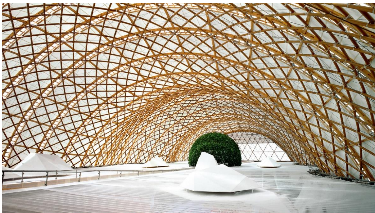
Рисунок 1 – Японский павильон изнутри

«Человек, природа и технология: зарождение нового мира» – именно такая тема была выбрана для всемирной выставки Ехро 2000, которая проходила в Ганновере, Германия, в 2000-м году. Выставочная территория представляла собой целый город со своими улицами и зданиями, которые поражали не только простых посетителей, но и инженеров своей изобретательностью, простотой и экологичностью. В данной статье будет уделено внимание выставочному павильону Японии.