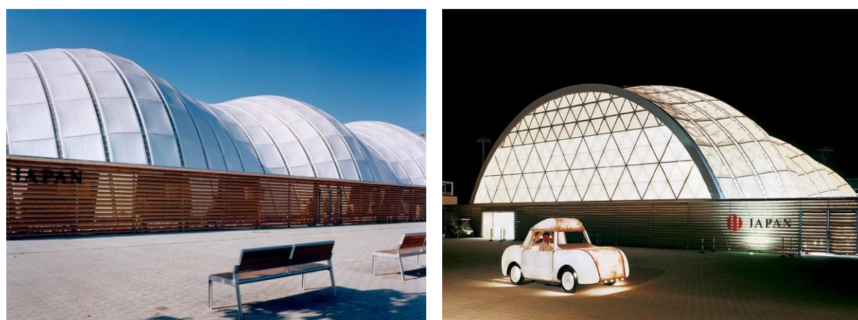
Рисунок 4 – Павильон снаружи днём и в вечернее время

Таким образом, японский павильон на выставке Expo 2000 является единственным в мире сооружением таких размеров, выполненным из бумажных материалов. Оно является своего рода шедевром инженерной мысли,