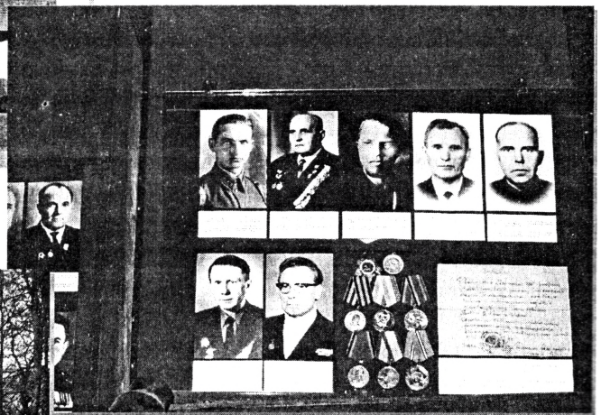
Музей народной славы в Ушачах