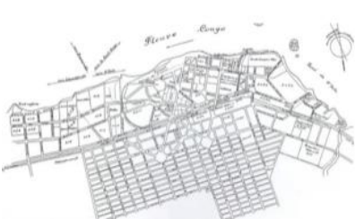
Рис. 3. Генплан 1919 г.

Колониальный период (1482–1960 гг.) Первыми европейцами были португальцы в XV веке. Однако колонизировали Конго бельгийцы, которые использовали междоусобицы в местных феодальных государствах. Город был основан в 1881 году знаменитым исследователем Африки Генри Мортонем Стэнли и создавался как торговый пункт. Первоначально город был назван Леопольдвилем (до 1966) в честь бельгийского короля Леопольда II. В Сводном диагностическом отчете указано, что в то время на равнинной территории современного города находилось ориентировочно около 66 деревень и 30 тыс. жителей. Это место было выбрано в качестве основы создания города вдоль реки Конго, где в 1888 году был создан район Стэнли-Пул и появились объекты городского обслуживания (полицейский участок, морской и транспортный, суды, почтовые отделения, таможня и др.), а также необходимая медицинская инфраструктура. Между портами Матади и Леопольдвиль была проложена железнодорожная ветка. Тогда же к востоку от города возникает район Кинтамбо, в котором появляются большие проспекты, виллы [4]. С 1900 по 1920 годы получили свое развитие новые районы города. Один из таких районов запроектировал Жорж Мулаэра, который представлял типичный образец новых жилых районов того периода (Рис. 3).