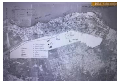
Рис. 4. Генплан (Réné Schoentjes 1933 г.)