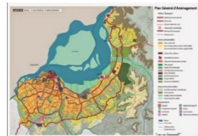
Рис. 8. Генплан 2013 (Sosak)

Киншаса занимает совершенно особое место, которое было выбрано бельгийскими властями из-за его географических преимуществ: близость к реке, аллювиальная равнина, простота урбанизации. Но рост города быстро превысил первоначальные возможности этого благоприятного места. В 1922 году был издан указ, который требовал от всех компаний