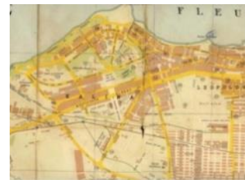
Рис. 5. Генплан 1940 г.