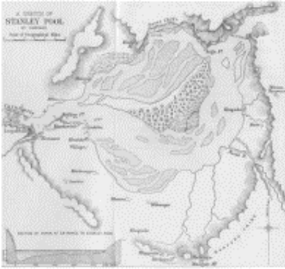
Рис. 1. Карта (Comber, T.J., 1884)