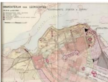
Рис. 6. Генплан 1949 г.