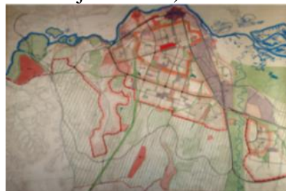
Рис. 7. Генплан 1967 г.