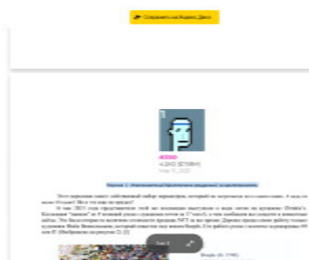
Рисунок 1 – Инопланетный Криптопанк, проданный за криптовалюту

Дороже продал свою работу только художник Майк Винкельманн, который известен под ником Beeple. Его работа ушла с молотка за рекордные 69 млн $(рис. 2).