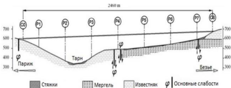
Рис. 4. Упрощенный геотехнический разрез виадука

существующими обнажениями (классификация RMR – rock mass rating). RMR варьируется от 0 до 105. Средние значения, зарегистрированные на участке виадука Мийо, составляют 65 для известняка и 53 для мергеля. Вдоль виадука есть три разных типа каменных оснований.