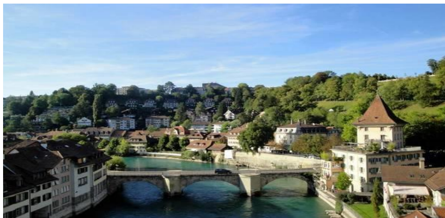
Рис. 2. Внешний вид моста Унтерторбюкке

вения с 1980 года. Кроме того, эта плита распределяет концентрированные нагрузки.