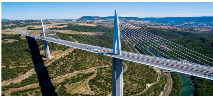
Рис. 5. Внешний вид виадука Мийо

Первый, байосский доломитовый известняк на северном устье (C0), представляет собой очень твердую породу, но с карстами, заполненными глиной. Известняк - карбонатная порода, состоящая, главным образом, из кальцита с примесями глины и песка. В верхней части платформы, на которой был установлен плот, было определено значение RMR 70–80.