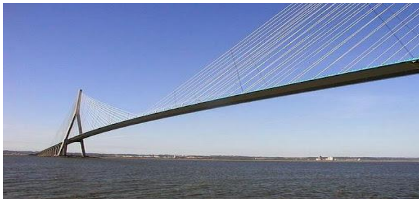
Рис. 7. Внешний вид моста Нормандии

вающие проезжую часть, имеют высоту 215 м. Известняк, который может переносить нагрузку, встречается только на глубине 40 метров. Таким образом, все фундаменты опираются на бетонные сваи диаметром от 1,5 до 2,1 м и длиной до 55 м. Под северным подходом находится слой ила толщиной 4 м, что потребовало строительства временного строительного моста, с которого были выполнены все фундаментные работы.