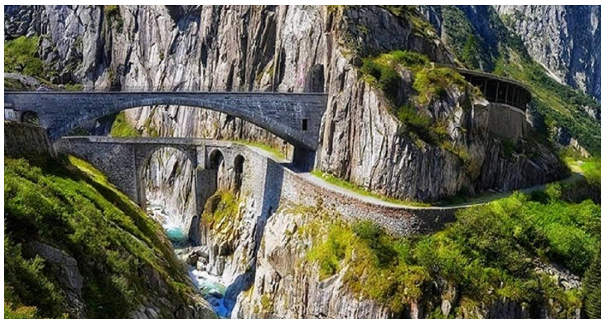
Рис. 3. Внешний вид моста Тейфельсбрюкке

башня, и всего на 40 метров ниже, чем Эмпайрстейт-билдинг в Нью-Йорке.