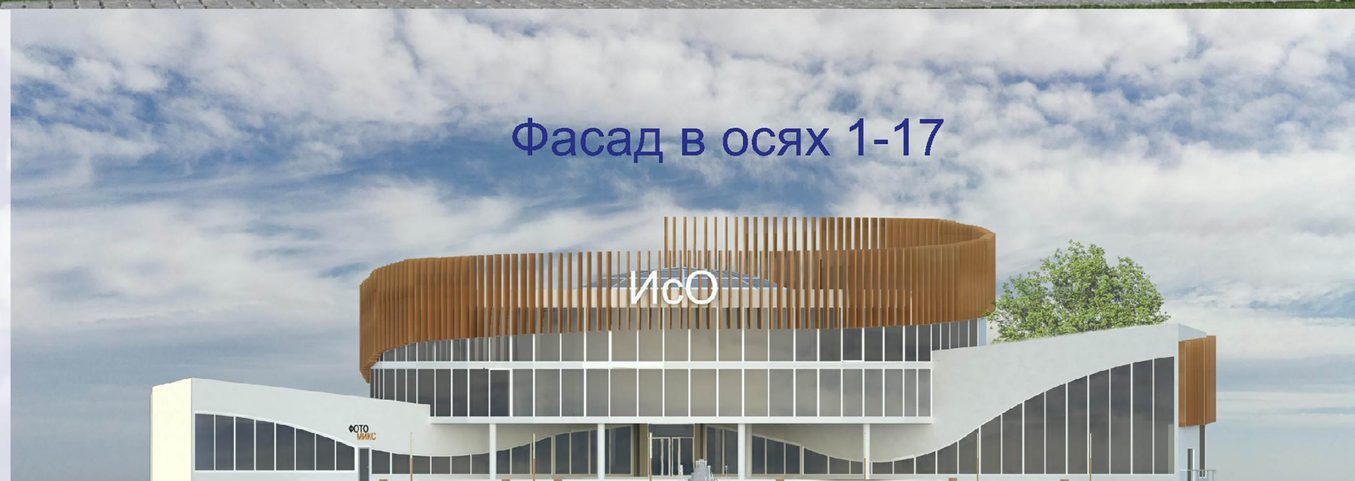
Фасад в осях 1-17