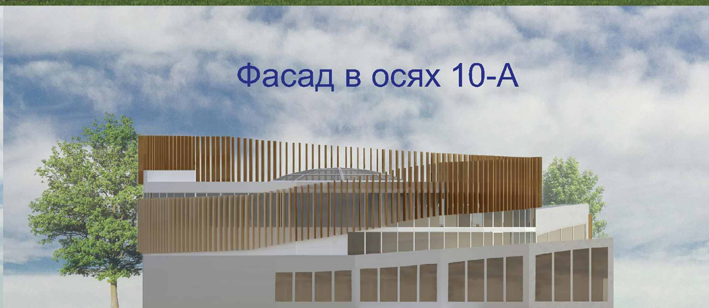
Фасад в осях 10-A