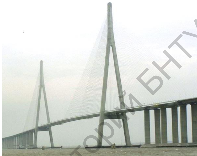
Рисунок 1 – общий вид моста «Сутун».

ществ таких вантовых мостов является неподвижность дорожного полотна.