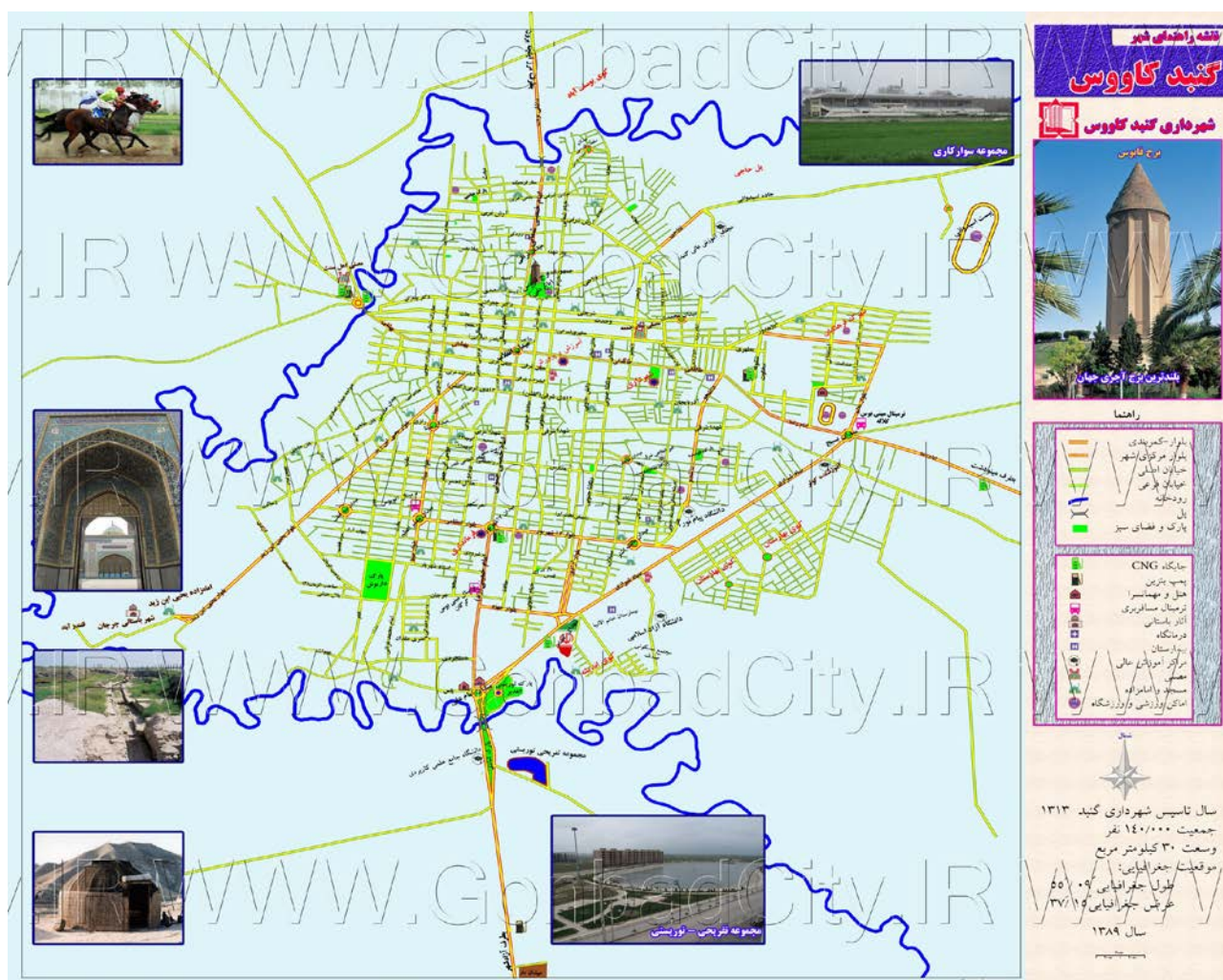
Рис. 2. Город Гонбад-е-Кавус (обл. Голестан), прямоугольная система структур города

Прямоугольно-диагональная система возникает как дальнейшее развитие прямоугольной сети улиц, которая дополняется диагоналями, ведущими в центр. Таким образом, решается проблема прямой связи периферии и центра, а также выделяется композиционный центр города. Диагональные улицы создают дополнительные возможности по композиционным акцентам (монументов, скверов и т. д.). К основным недостаткам этой системы относят усложнение некоторых перекрестков, а также появление треугольной формы кварталов. Прямоугольно-диагональная система улиц выявлена в городах Фариман, Салмас и Дезфул [12] (рис. 3).