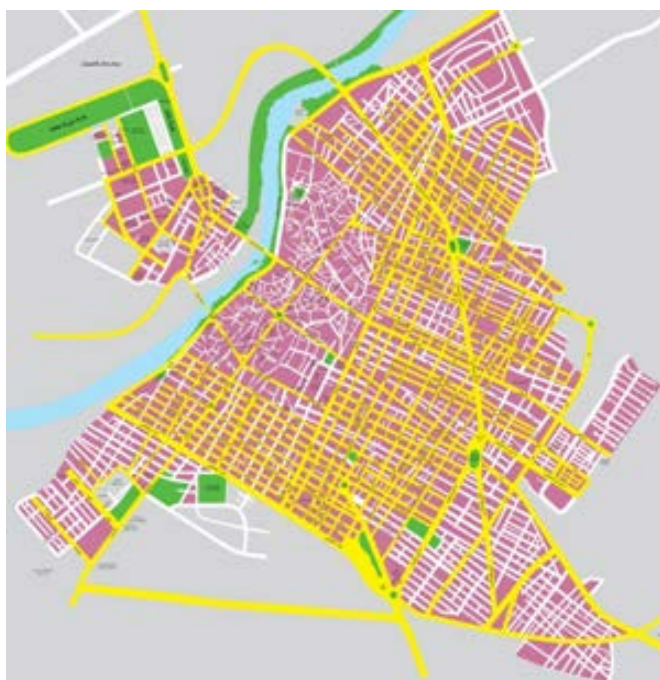
Рис. 3. Город Дезфул (обл. Хузестан, Иран), прямоугольно-диагональная система структур города

Органическая (свободная) планировка возникает или стихийно, как результат приспособления к особенностям сложного рельефа, или специально проектируется в целях создания живописной композиции [13]. Система названа органической, потому что ее можно сравнить с