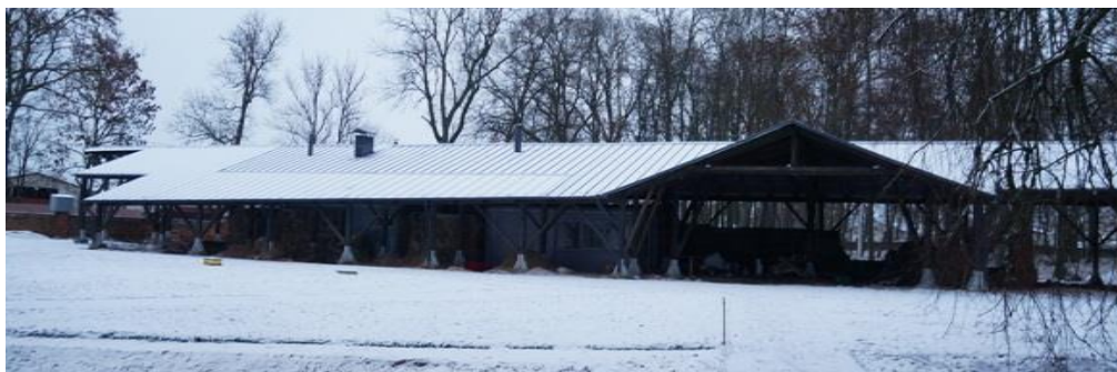
Рис. 1. Придорожное кафе на месте бывшей конюшни в аг. Подороск Волковысского р-на. 2015–2020 г. Арх. Н. Дорошкевич

Задача сохранить руины как ценный объект была поставлена проектным бюро Белорусского ИКОМОСа в проекте небольшого придорожного кафе на месте бывшей конюшни в аг. Подороск Волковысского р-на. Этот объект не являлся реставрацией в полном смысле слова, по сути это навес, частично выполненный из светопрозрачного поликарбоната, защитивший руины от осадков, и временные павильоны заводского изготовления, установленные без фундаментов (рис. 1).