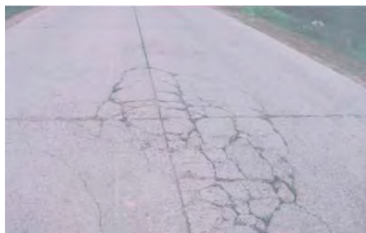
Фото 1. Трещины на дорожном цементобетонном покрытии

на с позиции континуумизации. Исходная дорожная конструкция в процессе эксплуатации изменяет свое качественное состояние: от бездефектной до разрушенной. Состояние разрушения определяют причины, ведущие к возникновению различных видов дефектов и характеризующиеся количественными и качественными показателями. На основании этих показателей выбирают вид ремонта, после выполнения которого конечная система – разрушенная конструкция – переходит в исходную, и весь цикл повторяется на новом качественном уровне.