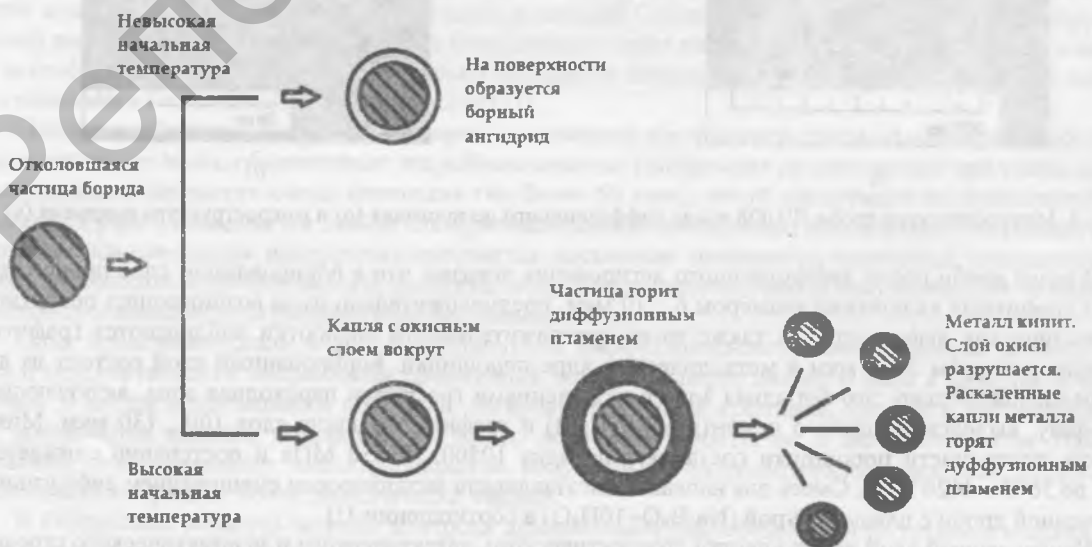
Рис. 3. Окисление частиц боридных диффузионных покрытий, образующихся при трении и соударении

Предполагаемый механизм окисления и горения частичек боридов представлен на рисунке 3.