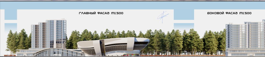
ГЛАВНЫЙ ФАСАД М1:500